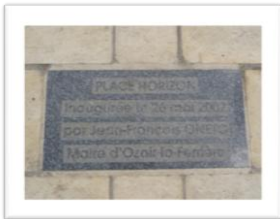
Plaque d'inauguration de la place Horizon le 26 mai 2007