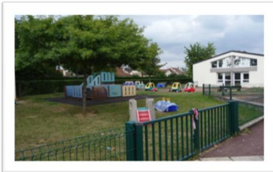
J eux du jardin de la crèche

décide de créer, en 1994, une nouvelle crèche familiale d'une capacité de 120 places. Et en 2001 sa halte garderie et son relais d'assistantes maternelles.