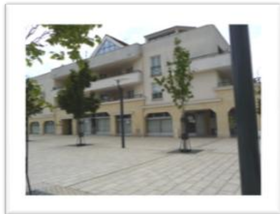
Nouveaux locaux et commerces de la place Horizon