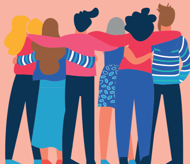
Conception graphique : Ville Ozoir-la-Ferrière - 2019