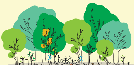
Ouverture de cloisonnements d'exploitation larges de 4 mètres à intervalles réguliers dans la parcelle.