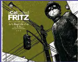
Fritz the cat (Cyril) de coffee break records (beatmaker/composition)