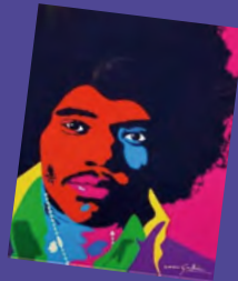
Portrait original réalisé dans le cadre de l'édition 2023 du Festival Jazz and Co pour le concert autour de Jimi Hendrix

À retrouver également le soir des concerts le 27 avril à Lésigny le 28 avril à Férolles-Attilly du 2 au 4 mai à Tournan-en-Brie le 5 mai à la Maison de la Culture et des Loisirs à Gretz-Armainvilliers erwanngauthier.com